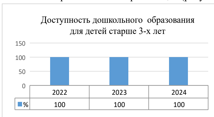
Рис.2 Рост доступности дошкольного образования на территории муниципального округа город Славгород Алтайского края, (в %)

С целью сохранения достигнутого показателя специалистом дошкольного образования ежемесячно осуществлялся мониторинг очередности детей для получения мест в дошкольных образовательных организациях, наличия вакантных мест. Результаты мониторинга являлись основой для ежемесячного текущего комплектования дошкольных образовательных организаций (рисунок 2).